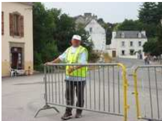
je positionne des barrières pour guider les automobilistes