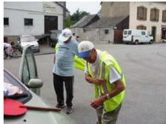
Nous nous équipons avant de prendre nos postes