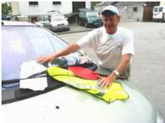
J'ai tout mon matériel : arrêté préfectoral, chasuble, K10 et ma bouteille d'eau