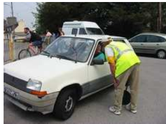
J'informe courtoisement les automobilistes de la situation