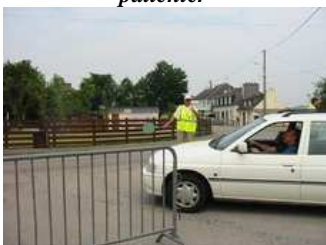
j'autorise le passage des véhicules