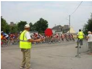
Au passage de la course, je stoppe la circulation et demande aux automobilistes de patienter