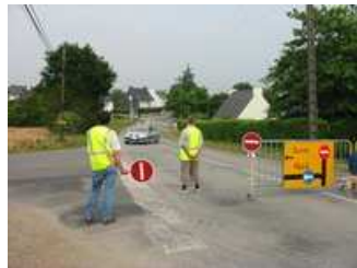
Pour les carrefours importants, nous utilisons des panneaux indicateurs de direction