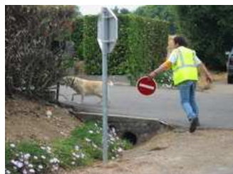
Je garantis la sécurité en toutes circonstances